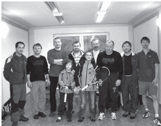
Vánoční tenisový turnaj 12 - 2010