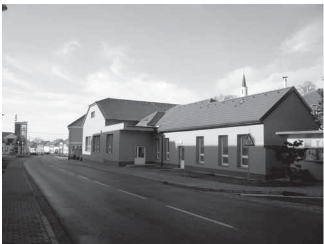
Kulturní dům po opravě