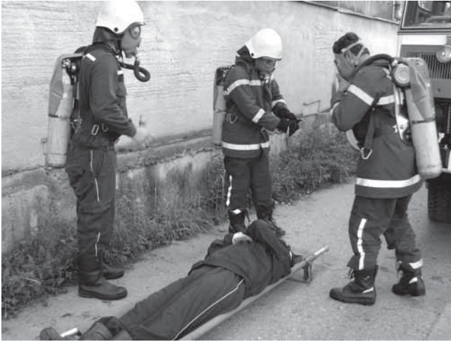
Aplikační cvičení - první pomoc