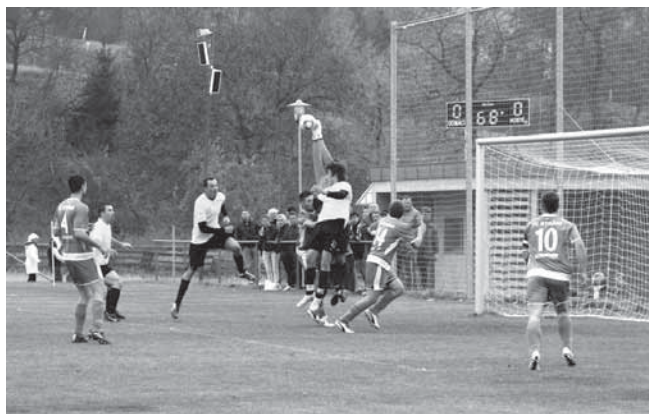
Podzimní zápas Pitín x Strání

Vraťme se však do uplynulší jarní části fotbalové sezóny 2010/2011, kdy jsme v konečném zúčtování obsadili střed tabulky a skončili na dobrém 8. místě. Nyní musím konstatovat, že to byla třetí sezóna v Okresní soutěži, ale zároveň byla nejtěžší. V jarní části jsme totiž bojovali o záchranu v samotné soutěži. Tento cíl se podařil především díky skvělému nástupu do jarní části, kdy jsme posbírali důležitá vítězství a odskočili jsme tak