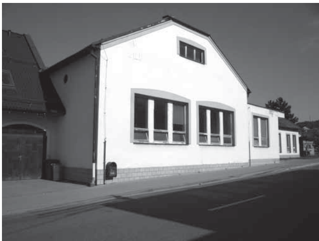
Kulturní dům před opravou