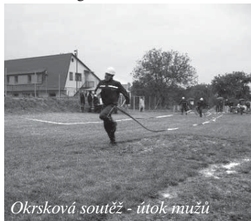
Okrsková soutěž - útok mužů

28. května jsme uspořádali ve sportovním areálu NIVA Okrskovou soutěž v požárním sportu. Na jaře jsme zakoupili dvě nové sportovní savice, se kterými jsme na této soutěži, i za nepříznivého počasí, dosáhli opravdu výborných výsledků. Mladší i starší žáci obsadili 1. místo, ženy taktéž 1. místo a muži 4. místo. 1. místo v kategorii muži obsadilo družstvo z Bojkovic, taktéž družstvo mužů nad 35 let. Celkem se soutěže zúčastnilo 14 soutěžních družstev. Všem zúčastněným patří poděkování a vítězům gratulace!