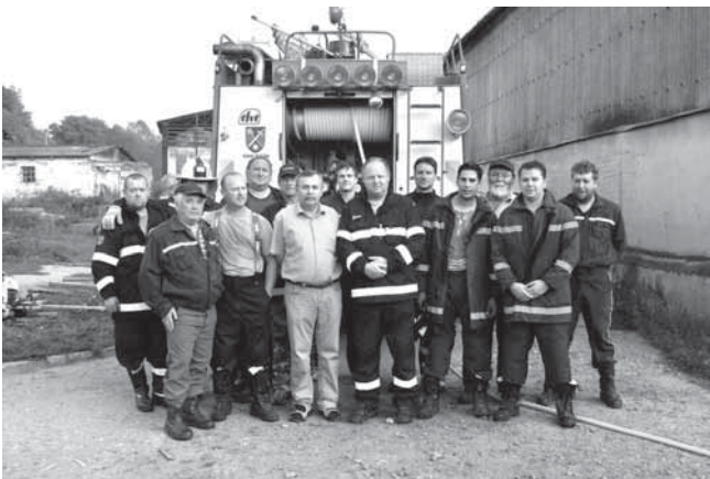
Aplikační cvičení - zúčastnění členové

I letos jsme pokračovali v opravách staré hasičské zbrojnice. Na nástěnce, která je vedle ní, pravidelně informujeme členy o akcích, brigádách a změnách ve sboru, taktéž o změnách konání výborových schůzí. Obecně platí, že výbor se schází každý