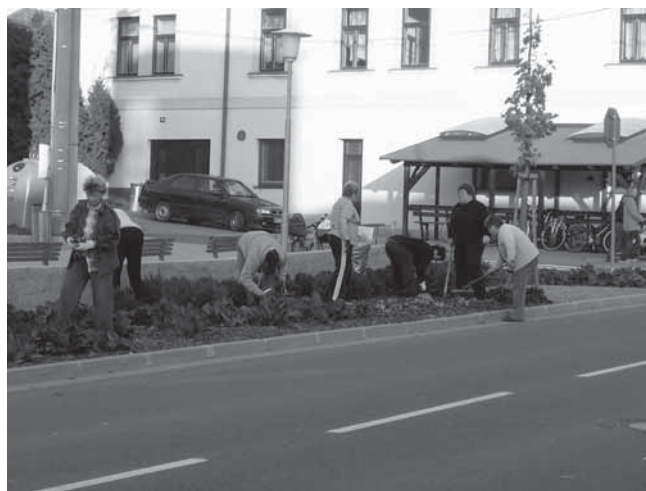
ČČK úklid veřejného prostranství