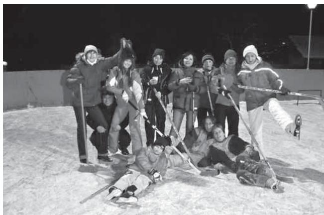
Silvestrovský hokej žen 2010