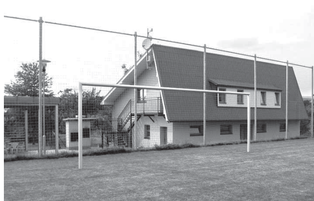
Rekonstruovaná hlavní budova

REGION TEAM – FC Čechie Uhřetěves 1:3 (0:1) , Uhřetěves obhájila turnajové prvenství z roku 2010