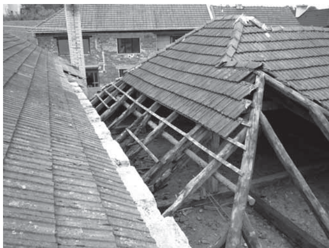
Střecha kulturní dům