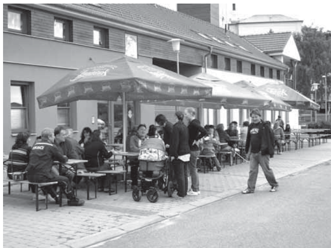
Posezení u hasičárny

Poděkování patří všem, kteří se aktivně podílejí na bezpro-