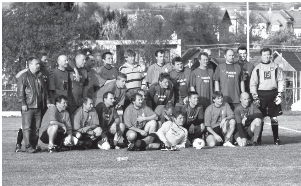
Stará Garda TJ Pitín vs. Stará Garda Ostrožská Lhota

Do aktuální sezóny 2011/2012 jsme vstupovali s několika posilami, ale tou nejpodstatnější bylo především to, že domácí zápasy jsme již zahájili na domácím hřišti v Pitíně. Po roce v azylu jsme tak konečně okusili, jak chutná pažit na nově zrekonstruovaném hřišti, které doznalo řady změn. Tou hlavní je především rozměr. Ten se nafoukl a dnes máme hřiště, které má parametry požadované fotbalovou federací UEFA. Byl instalován automatický závlahový systém, osazeny nové hliníkové branky, nové záchytné sítě, nový plot kolem celého hřiště a v neposlední řadě zábradlí. Rovněž správní budova dostala zcela nový kabát včetně zateplení a výměny oken. Investorem této rozsáhlé investiční akce byla Tělovýchovná jednota Pitín, která tak obecní majetek revitalizovala a oblekla do nové podoby.