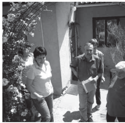
Návštěva Pitínských Kopanic