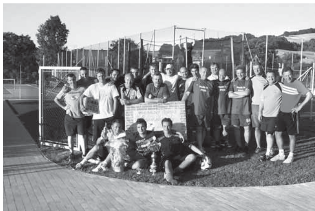
Nohejbalový turnaj O pohár starosty Pitína