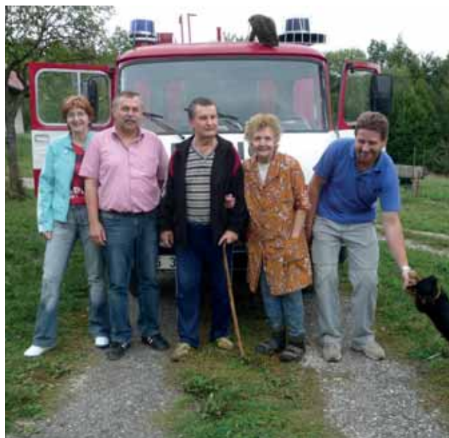
návštěva Pítnských Kopanic