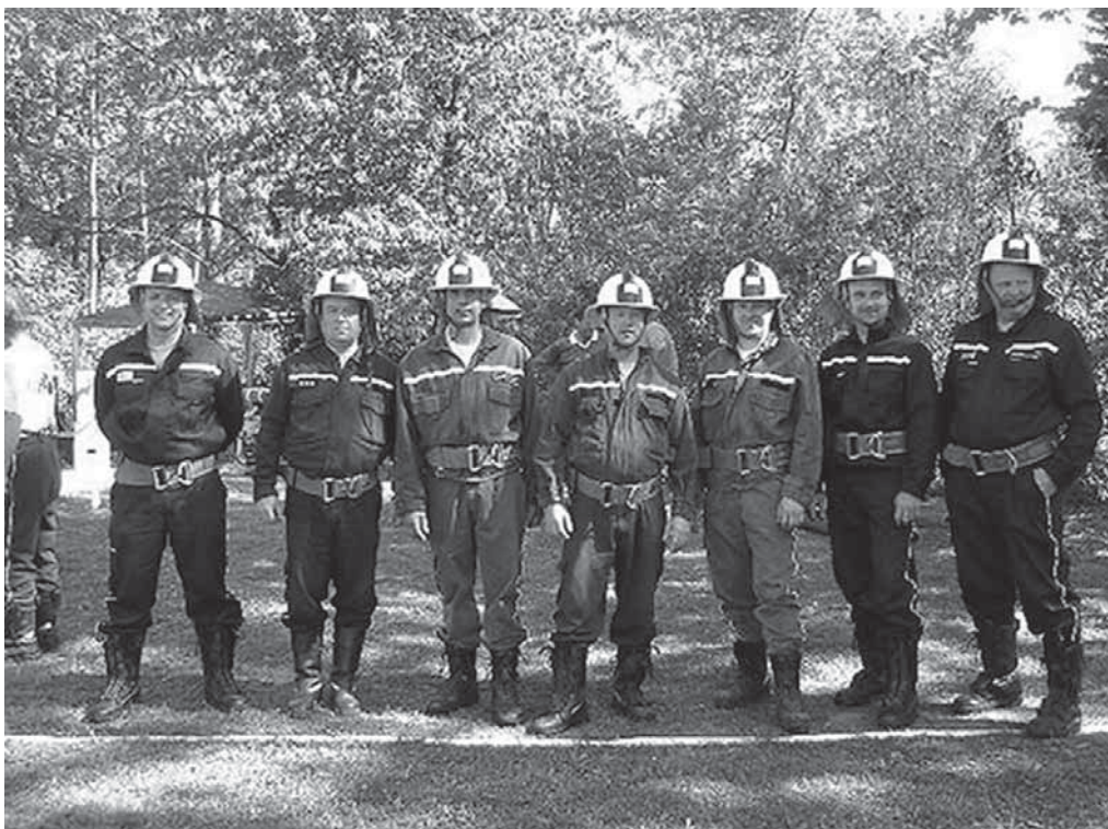
Starší páni - okrsková soutěž

15. září jsme uspořádali "Rozloučení s létem" u hasičárny. Nabízeli jsme zabíjačkové speciality, připravili jsme bohatou tombolu. Svou návštěvou nás poctil známý cestovatel a podnikatel, pan Tomio Okamura. 27. září proběhlo v areálu