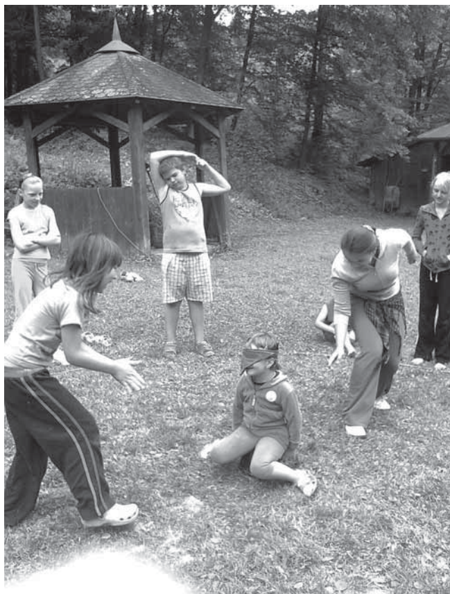
O prázdninách odnesly mladé Orlíky rozbouřené vody až ke břehům pustého ostrova,