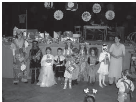
Stejně jako každý rok jsme si zařídili na karnevale...