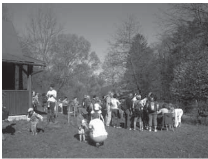
...a po zimě protáhli zkrěhlé svaly na jubilejním desátém ročníku Pitěnského škrpálu.