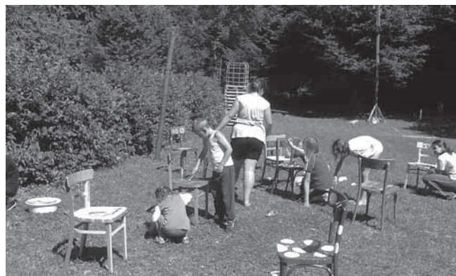
...kde se naučili mnoho užitečných věcí.