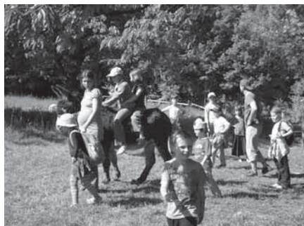
Před prázdninami jsme se společně se školní družinou vydali na výšlap k Bělušovým na Žitkovou...