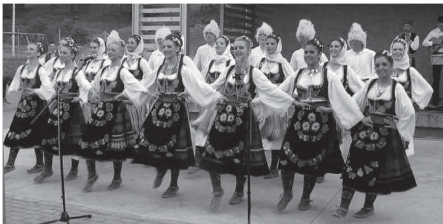
S písničků do Pitína