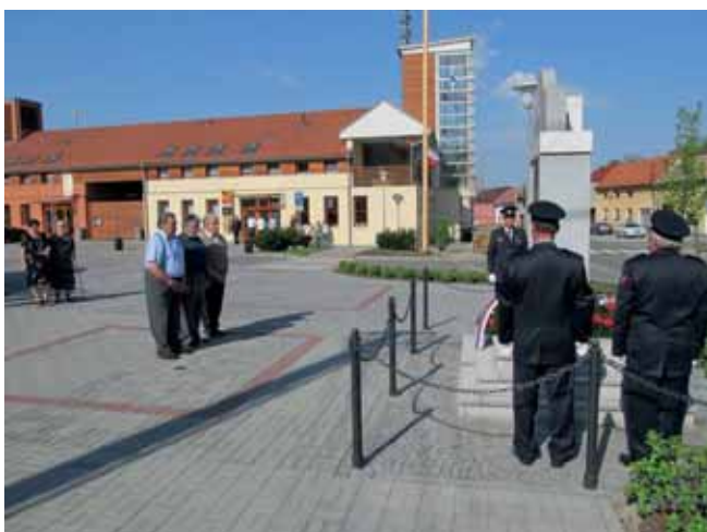
pietní vzpomínka u pomníku padlých v I. a II. sv