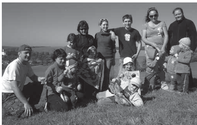
S přicházejícím podzimem jsme se pustili do stavby draků, které jsme hromadně vypustili do vzduchu začátkem října

Do konce roku nás čeká už jen mikulášská a vánoční besídka, ale už teď se těšíme na příští rok. Kromě pravidelných každoročních akcí bude naše jednota v roce 2013 pořádat i fašankovou obchůzku, hodovou zábavu, stavění a kácení máje. Doufáme, že se na některé z těchto akcí uvidíme :-)