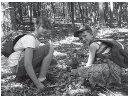
...a prošli se Pohádkovým lesem.