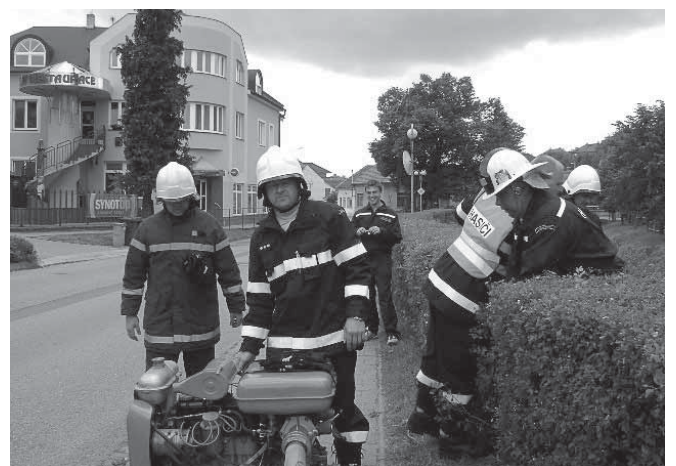
Taktické cvičení Bojkovice