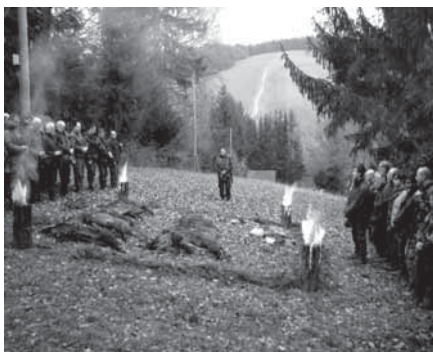
Výřad na naháňce na černou zvěř 15. 11. 2014

V listopadu jsme zorganizovali naháňku na černou zvěř. Za pomoci mysliveckých hostů a honců, jsme mohli obstarat velké leče, ve kterých jsme po obeznání předpokládali přítomnost černé zvěře. Vynaložené úsilí se vyplatilo, a i za přísných bezpečnostních podmí-