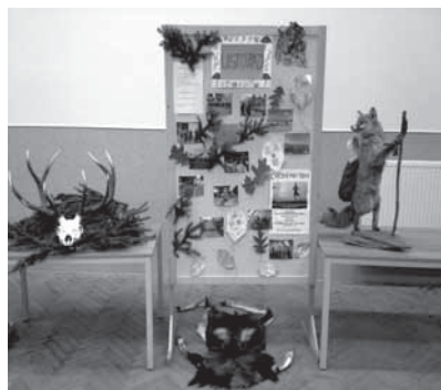
Nástěnka MS Pitín – Hostětín o.s. v soutěži „obec roku“