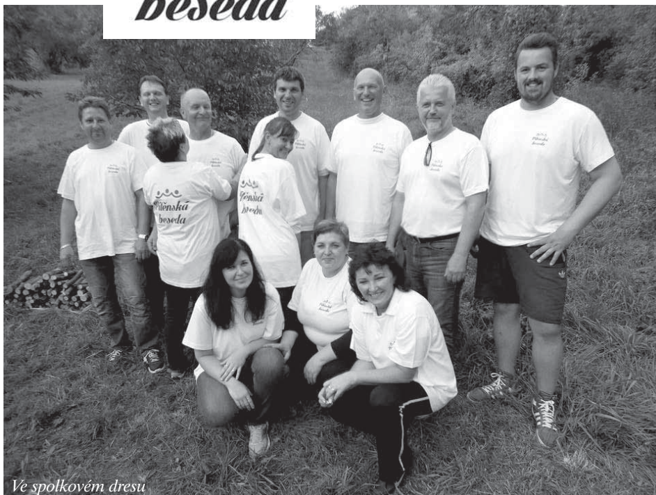
Vě spolkovém dresu

videlně v Café Holzer pořádat kytarové posezení (za účasti zajímavých hostů, např. J.A. Náhlovský...aj); na jaře v roce 2016 máme v plánu uspořádat KOŠT slivovice z pitěnských trnek. Zkrátka aktivit máme v hlavě hodně, je otázkou na kolik bude v našich si-