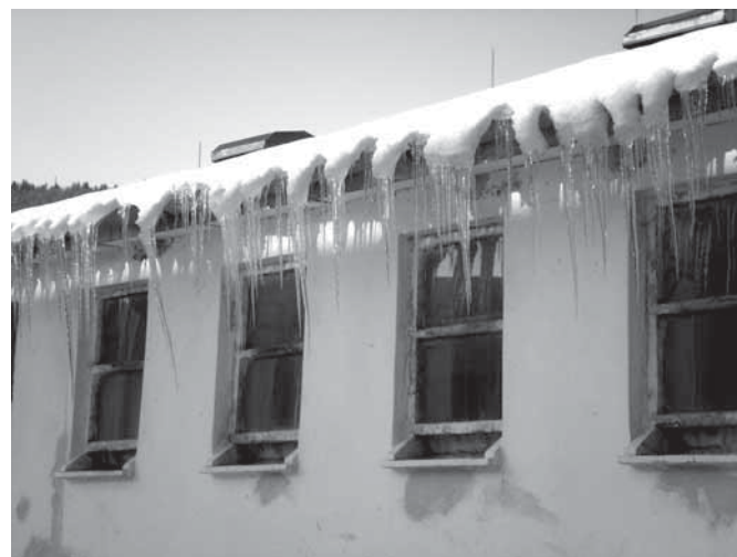
Leden na farmě