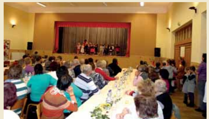
Beseda s duchodci