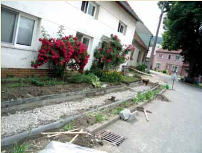
Rekonstrukce chodníků Kút