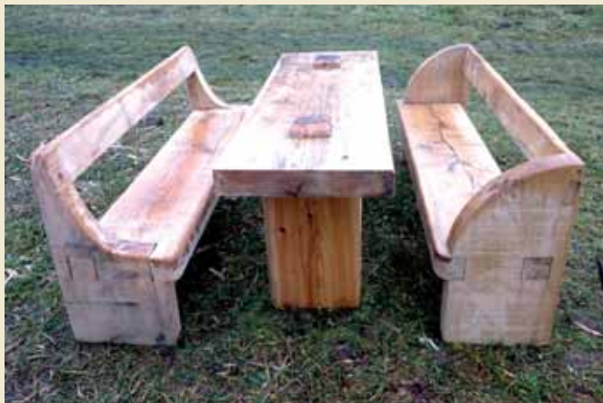
Dětská naučná stezka - odpočívadlo