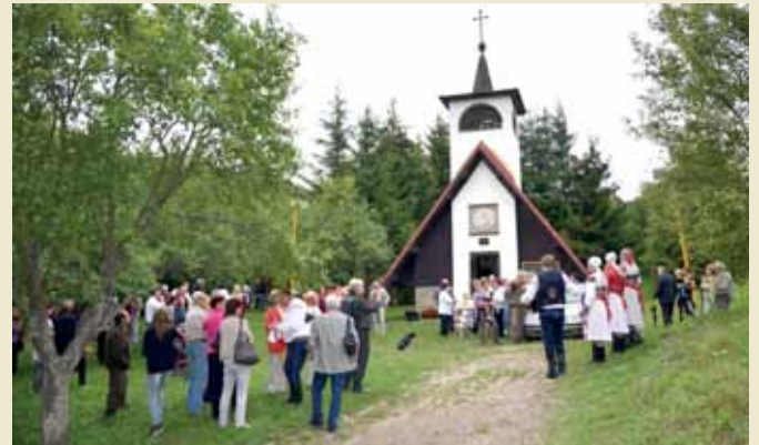
Hody na Pitínských Pasekách