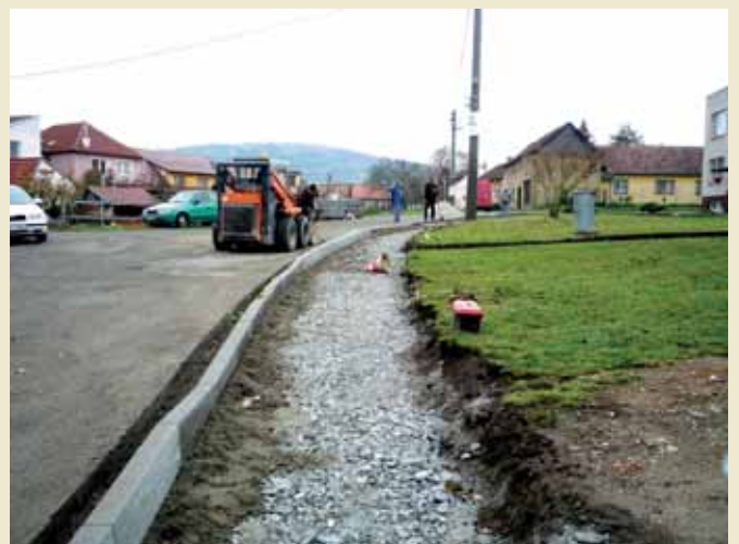
Rekonstrukce obce - Kút