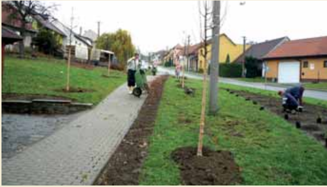
Výsadba zeleně - Smolovec