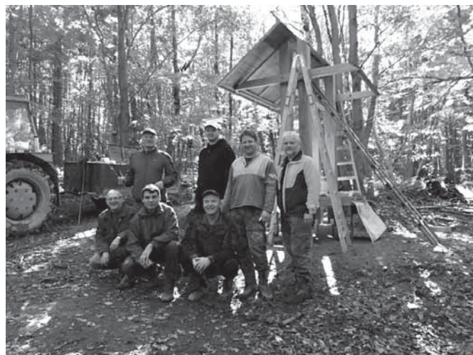
Úprava pramene Olšavy