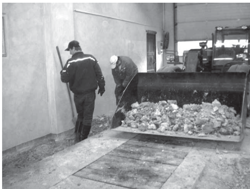
Rekonstrukce podlahy v opravářské dílně

Extrémní vedra začala sužovat i lidi a zvířata. Ostré paprsky červencového a srpnového slunce dokázaly spálit pastviny na