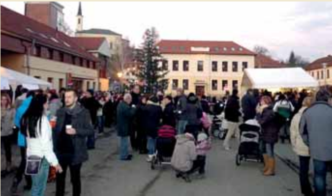
Rozsvícení pitínského stromečku