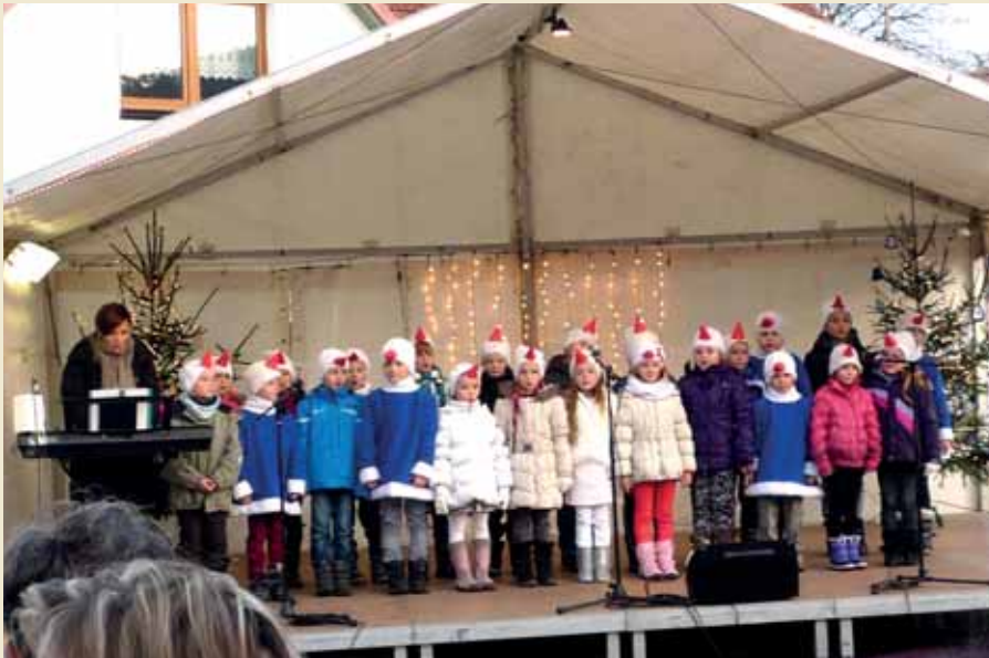
Rozsvícení pitínského stromečku