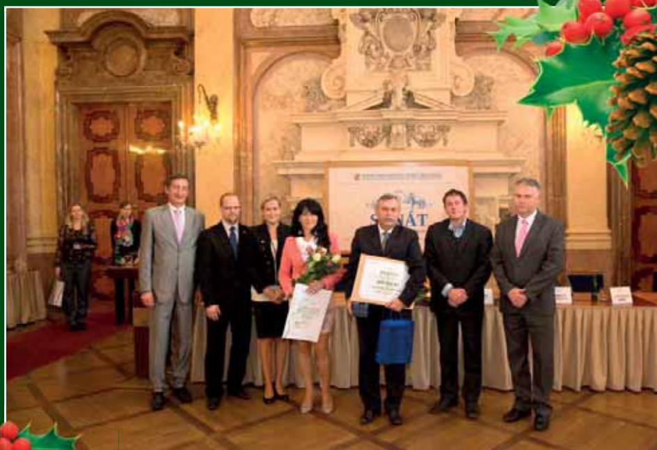
Soutěž „Vesnice roku 2015“