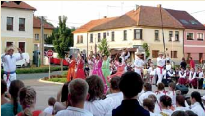
S písničkú do Pítna