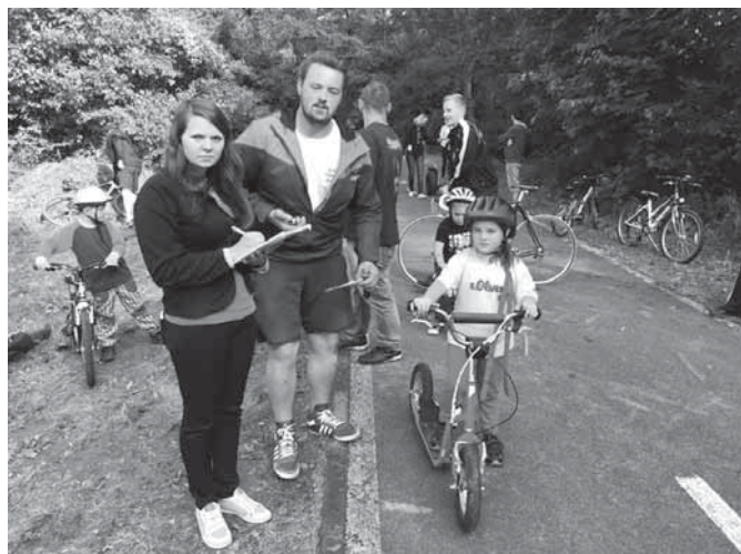
Akce Všechno co má kola