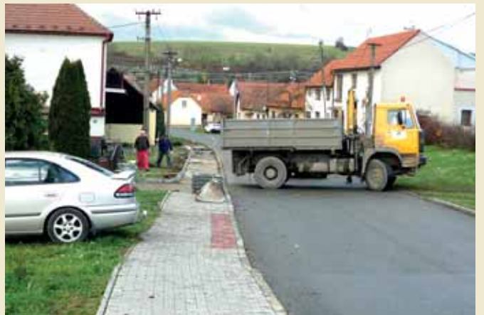
Nové chodníky na Horním konci